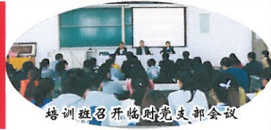
培训班召开临时党支部会议