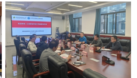
内蒙古农业大学水利与土木工程学院和能源与交通学院人员与西北农林科技大学水利与建筑工程学院人员交流