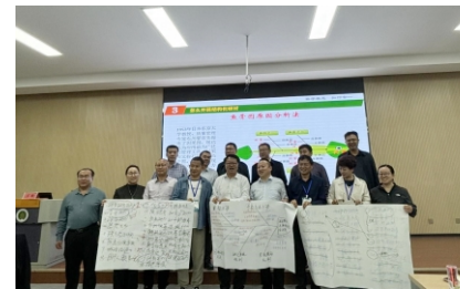
结构化研讨现场讨论